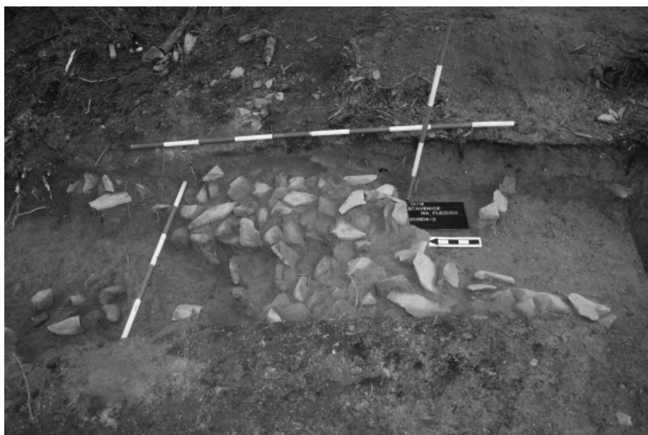
Obr. 9. Úsov (okr. Šumperk). Kamenný pás v koruně horního valu.