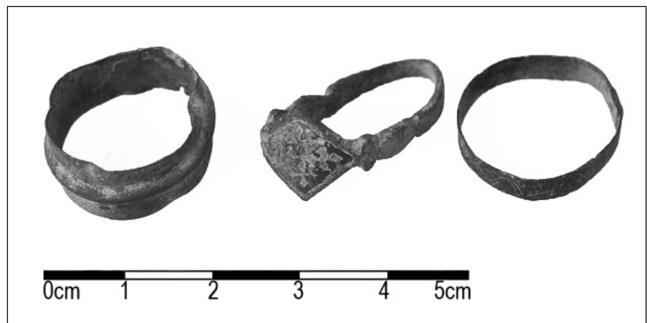
Abb. 67. Telč, Staroměstský Teich. Ringe.