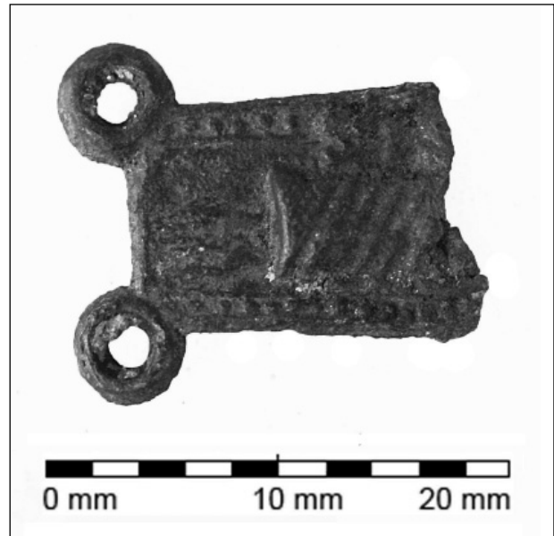
Obr. 66. Telč, Staroměstský rybník. Poutní odznak s rukou Krista.

Podle dosavadních nálezů se zde lidé natrvalo usadili v době začínající „velké středověké kolonizace“ během 2. poloviny 12. a na počátku 13. století. Jejich příchod do relativně nehostinných oblastí v polohách nad 500 m n. m. souvisel především s rozvojem obchodu, kvetoucího podél cest vedoucích z rakouského Podunají směrem do středních Čech a z Moravy do jižních Čech. Jedna z nich, tzv. Humpolecká cesta, spojující Dačicko s Humpoleckem, procházela údolím Telčského potoka v blízkosti Starého Města, kde se předpokládá křížení s tzv. Telčskou