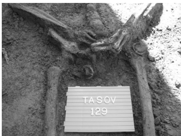
Obr. 63. Tasov. Hrob s přezkami.