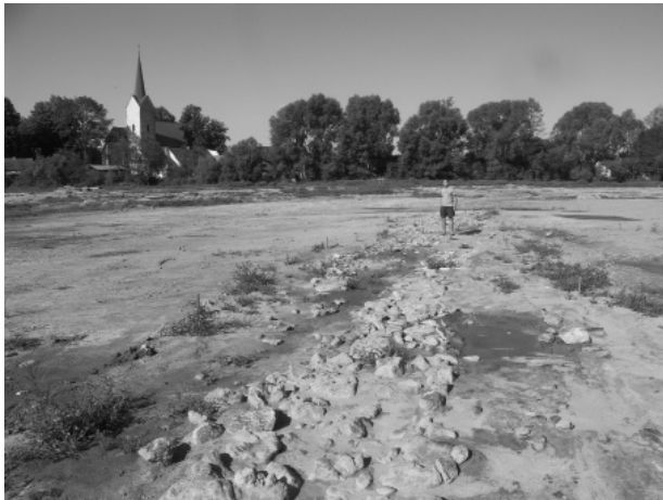
Obr. 65. Telč, Staroměstský rybník. Středověká kamenná cesta východozápadní orientace.