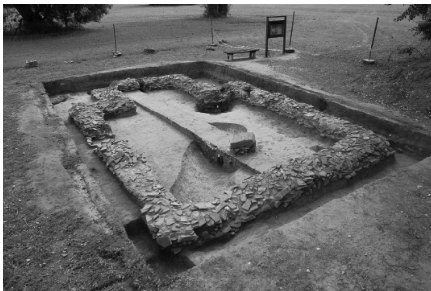
Obr. 50. Mikulčice-Valy, VIII. kostel v podhradí. Ověřovací výzkum kostela v roce 2011.

Mikulčický „desátý“ kostel byl zkoumán J. Tejralem a Z. Klanicou v letech 1963–64 (Klanica 1964, 50). Jde