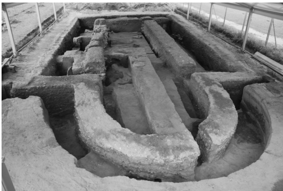
Obr. 49. Mikulčice-Valy, III. kostel na akropoli hradiště. Ověřovací výzkum interiéru trojlodí v roce 2011.