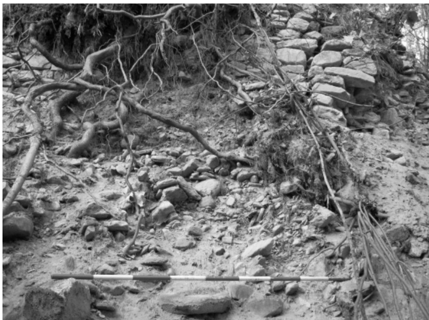
Obr. 1. Hrádek Adolfovice. Destrukce východní zdi.

Ohrožení lokality bylo nově potvrzeno na podzim 2011, kdy byly dne 25. 10. v prostoru jádra hrádku zjištěny nové nelegální výkopy. První výkop byl objeven v jihovýchodním rohu jádra. Jednalo se o zásah o rozměrech cca 0,8 x 0,4 m a hloubce až 0,3 m, nyní bez nálezů. Druhý výkop byl zjištěn na severozápadní straně jádra, položený z hrany svahu kolmo do příkopu. Rozměry činily 3,6 x 0,8–1,2 m, hloubka v horní části 0,5 m, ve spodní části 0,15 m. Ve vykopané zemině byly nalezeny ojedinělé drobné fragmenty keramiky a železné předměty. V bezprostřední blízkosti tohoto výkopu pak byly na ploše jádra zjištěny další menší zásahy schované pod listím. Všechny tyto výkopy byly zdokumentovány písemně