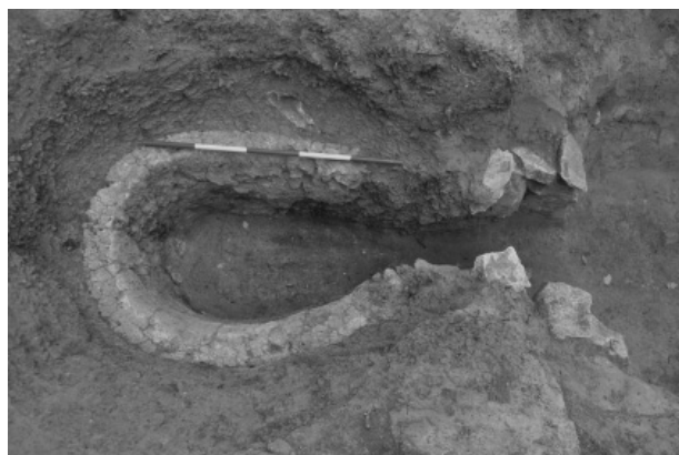
Obr. 56. Mokrý-Horákov. Vápenická pec z období pozdního středověku.

Abb. 56. Mokrý-Horákov. Kalkofen aus dem Spätmittelalter bis der frühen Neuzeit.