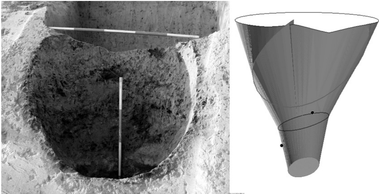
Obr. 55. Modrá, „Hrubý díl“. Dehtařská jáma.