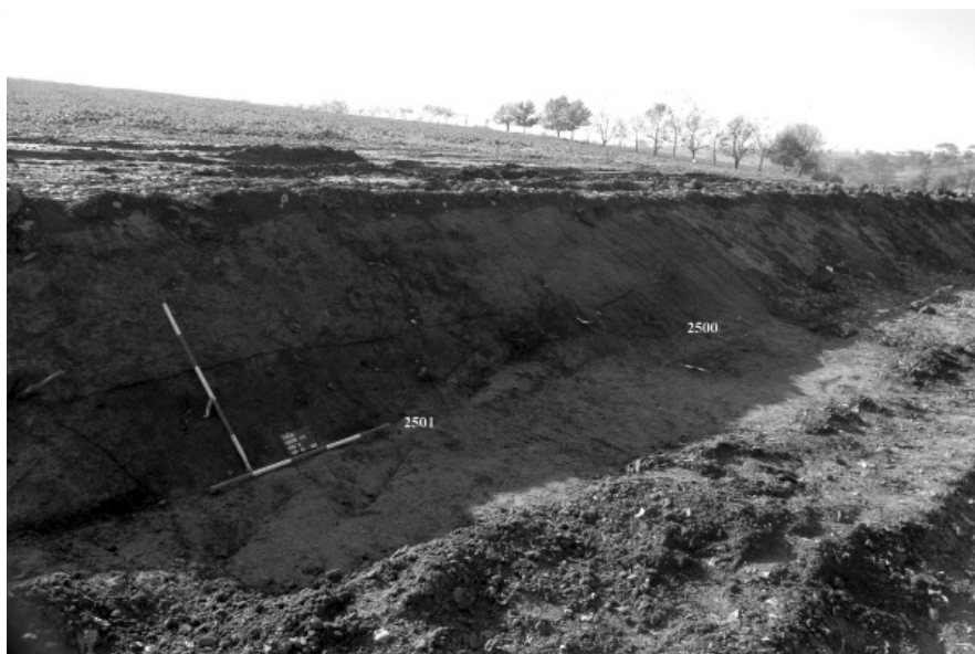
Obr. 69. Tučín. Pohled od východu. Objekty 2500, 2501.