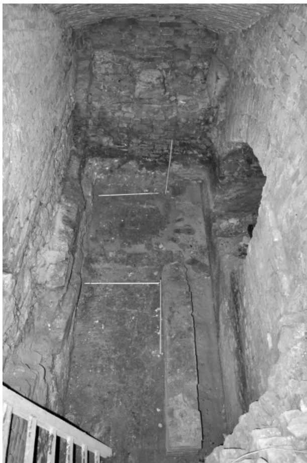
Obr. 71. Uherské Hradiště, Masarykovo náměstí. Barokní sklepení.

Abb. 71. Uherské Hradiště, Masaryk Platz. Barockkeller.