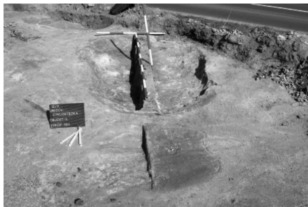
Obr. 72. Uničov, „Mezi silnicemi“. Objekt 5.

Schirmeisen, K. 1943: 15 Jahre Vorgeschichtsforschung in Mähr.-Neustädter Gebiet. Zeitschrift der Mährischen Landesmuseums, neue Folge, Band 3 , 90–150.