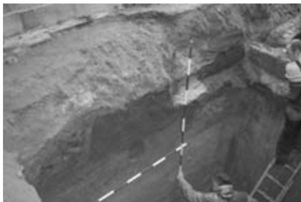
Obr. 101. Prostějov, zámek. Pohled na výkop s objekty od východu.

Prostějov (Bez. Prostějov), Pernštýnské Platz. Schloss, Neuzeit. Rettungsgrabung.