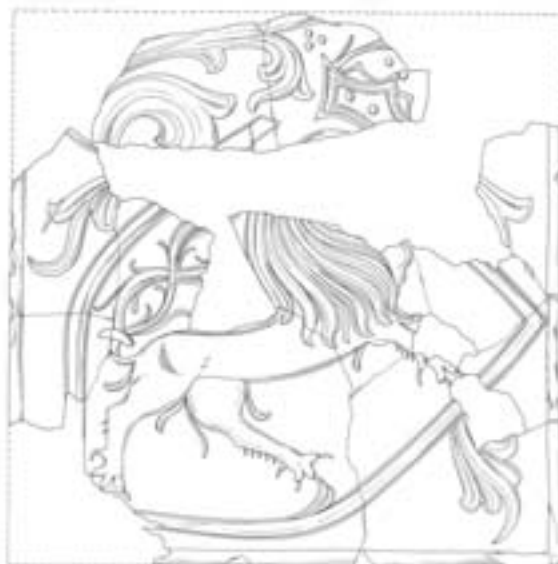
Obr. 102. Prostějov, zámek. Torzo kamenného kachle.

Abb. 101. Prostějov, Schloss. Blick von Osten auf die Grabungsfläche mit Gruben.