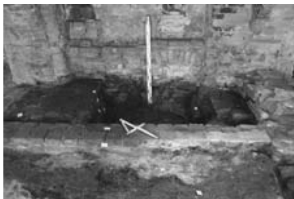
Obr. 107. Raduň. Pohled na podestu a stěnu severního nikového topeniště.

Za jeden z největších přínosů operativního průzkumu a archeologického výzkumu lze považovat identifikaci pravděpodobně již barokního topeništního systému, který využíval komfortního nepřímého vytápění, jelikož provoz praní a sušení prádla vyžadoval čisté prostředí. Ústředním prvkem soustavy byla dvě protilehlá niková topeniště (obr. 107) se zadržovacími pozorovacími a nakládacími otvory na stěnách (Kouřilová 2009). V navazujících místnostech pak stály přes zeď napojené vyvářovací kotle, či přesněji kamna. Pokročilost systému potvrzuje i fakt, že