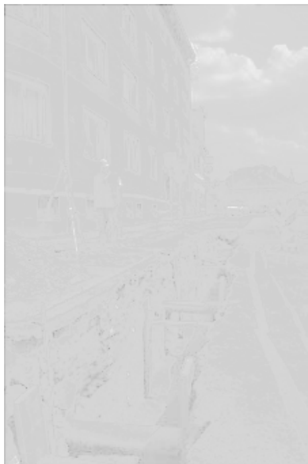
Obr. 43. Bruntál, ulice Požárníků. Profil P2 s raně novověkými zahlabenými objekty.

Abb. 42. Bruntál. Dr. E. Beneše Straße. Sondage S1 mit Resten des Souterrains des Hauses No. 163.