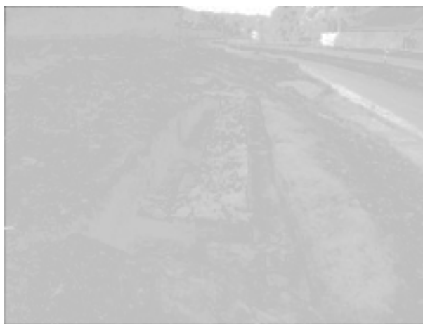
Obr. 44. Březolupy. Kamenné základy zaniklého hostince. Abb. 44. Březolupy. Steinfundament des ehemaligen Gasthauses.

Výzkum probíhal v trase přeložky silnice mezi Šarovy a Březolupy v trati Lapač. Mimo starší archeologické si-