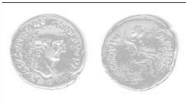
Obr. 9. Rymice. Denár císaře Tiberia. Abb. 9. Rymice. Denar des Kaisers Tiberius.