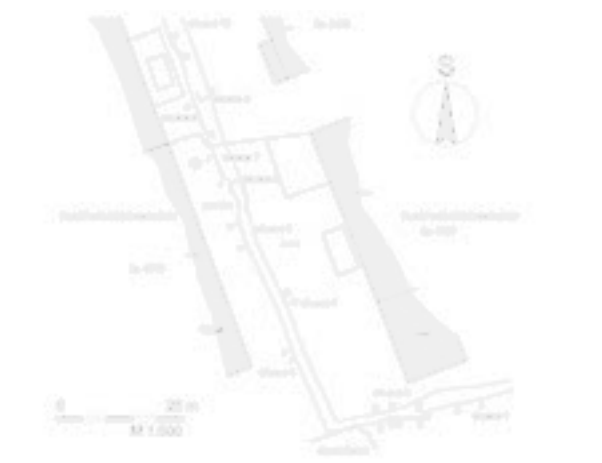
Obr. 2. Hodonín. Trasa záchraného výzkumu. Abb. 2. Hodonín. Trasse der Rettungsgrabung.

udává linie mezi body o souřadnicích 48°50'58.832"N a 17°6'58.109"E; 48°50'56.326"N a 17°7'0.052"E; 48°50'56.535"N a 17°7'1.484"E (WGS-84). Vedle běžné sídlištní keramiky se zde v několika případech nacházela i římsko-provinciální zdobená keramika. Jedná se o novou archeologickou lokalitu v katastru Hodonína (obr. 2).