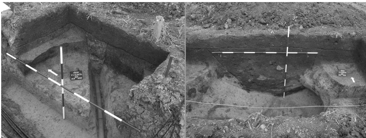
Obr. 18. Vícov, okr. Prostějov, „Díly pod dědinou“. Ukázka prozkoumaných sídlištních objektů lužické kultury. Abb. 18. Vícov, bez. Prostějov, Díly pod dědinou. Detail der Vorratsgrube.

Gottwald, A. 1906: Sídliště neolithická a nálezy kamených nástrojů na Prostějovsku, Časopis Moravského musea zemského VI, 41–61.