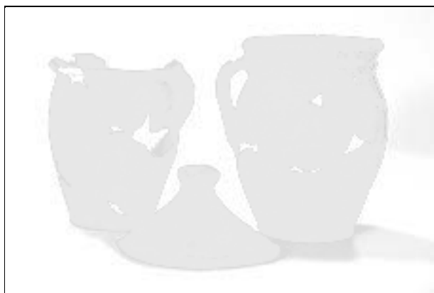
Obr. 118. Valašské Klobouky, Smetanova ulice. Výběr keramických nádob z 15. století.

Abb. 118. Valašské Klobouky, Smetanova StraÙe. Auswahl der Keramik aus dem 15. Jahrhundert.