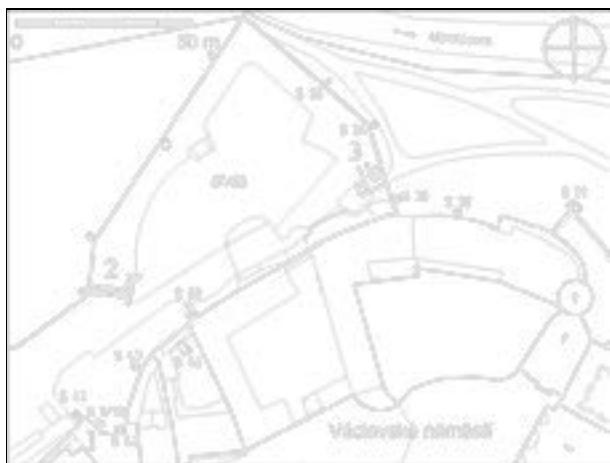
Obr. 88. Olomouc, Mlčochova, Dobrovského ulice. Poloha archeologických sond na DKM Olomouce. Abb. 88. Olmütz, Mlčochova, Dobrovského Str. Die Lage der archäologischen Sondagen im DKM Olomouc.