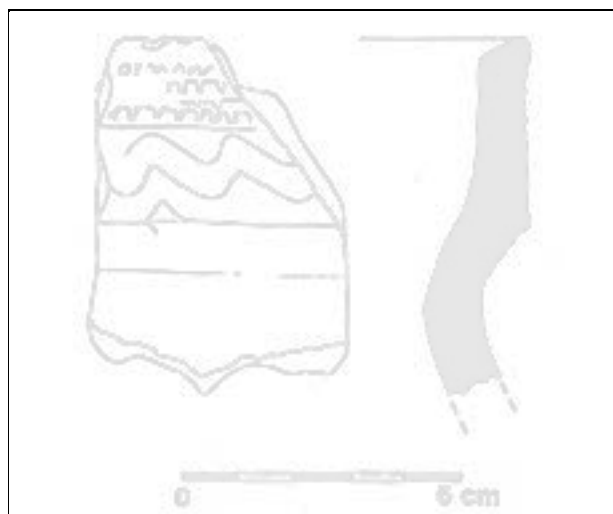
Obr. 91. Olomouc, Sušilovo náměstí. Okraj hrnce z k. 119 (kresba M. Schindlerová).

V severovýchodní části plochy výkop obnažil torzo kamenného zdiva (k. 905), pojeného písčitou nekvalitní maltou. Zdivo probíhalo SJ směrem, zachycen byl narušený západní líc. Východní líc se nacházel v nezkoumaném prostoru, měřitelná šířka zdi byla 0,60 m. Stáří zdiva nebylo zatím stanoveno, bližší údaje snad přinese srovnání polohy zdiva s dochovanými plány areálu bývalého kláštera. Základ zdi 905 byl zapuštěn do světle hnědé písčito-jílovité hlíny (k. 119), ze které byly získány zlomky keramiky, datovatelné do průběhu 13. stol. Pouze vzhůru vytažený okraj hrnce zdobený radélkem a vlnicí je možno blíže zařadit již do 1. poloviny 13. století (obr. 91).