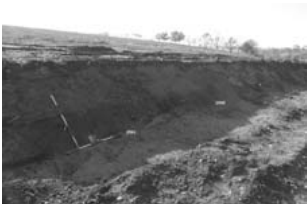
Obr. 114. Tučín. Pohled od východu na objekty 2500, 2501. Abb. 114. Tučín. Blick von Osten auf Gruben 2500, 2501.

vnitř prožlabeným. Ve výzdobě hrnců převažovaly horizontální obvodové žlábký umístěné na plecích nádob či šikmé vrypy umístěné pod hrdlem. Výjimečně se objevil i motiv jednoduché vlnice. V jednom případě se vyskytl větší fragment zásobnice s okrajem vytaženým vzhůru, přičemž směrem nahoru se zužujícím. Zásobnice je zdobena plastickou lištou, na které je umístěna jedna řada šikmých vrypů. V některých případech bylo v keramické hmotě patrné vysoké procento přimíšeného drčeného grafitu. Ze záspy objektu 2 500 dále pochází zlomky mazanice, jemnozrnného pískovce a sladkovodního vápence (travertinu), jehož zdroje se nacházejí při S okraji obce.