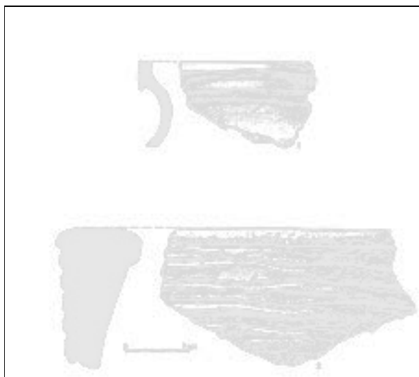
Obr. 113. Tršice. Výběr středověké keramiky (kresba I. Hradilová).

Tršice (Olomouc dist.). Mr. J. Vláčil found a collection of pottery in the acre of the house nr. 3 in the village called