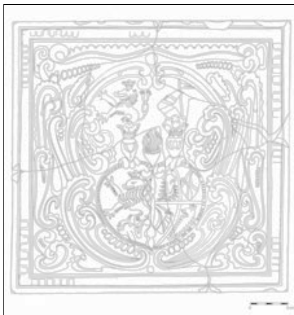
Obr. 120. Velké Losiny. Rekonstrukce kachle (kresba M. Schindlerová).