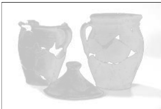
Obr. 118. Valašské Klobouky, Smetanova ulice. Výběr keramických nádob z 15. století.

Abb. 118. Valašské Klobouky, Smetanova Straße. Auswahl der Keramik aus dem 15. Jahrhundert.