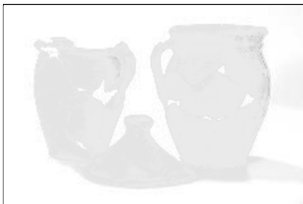
Obr. 118. Valašské Klobouky, Smetanova ulice. Výběr keramických nádob z 15. století.

Abb. 118. Valašské Klobouky, Smetanova Straße. Auswahl der Keramik aus dem 15. Jahrhundert.