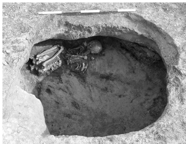
Obr. 7. Moravany. Kostrový pohřeb v zásobní jámě. Fig. 7. Moravany. A Skeleton Grave in a Storage Pit.