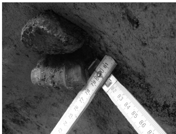
Obr. 2. Čejkovice, Masarykova ulice. Detail vsazené zvřecí kosti ve stěně sídlištní jámy.

One settlement feature belonging to the Middle Danube Tumulus Culture was excavated during a continuing rescue excavation in Černá Hora.