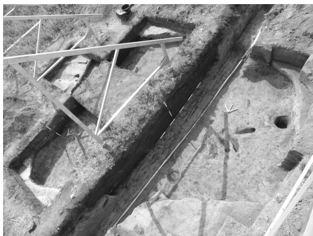
Obr. 1. Čejkovice. Pohled na zahloubenou stavbu č. 8.

Abb. 1. Čejkovice. Blick auf dem Grubenhaus Nr. 8.