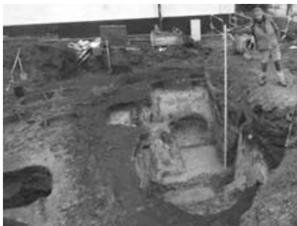
Obr. 47. Čejkovice, Templářská ulice. Pohled od SZ na suterén středověkého dřevohliněného domu.