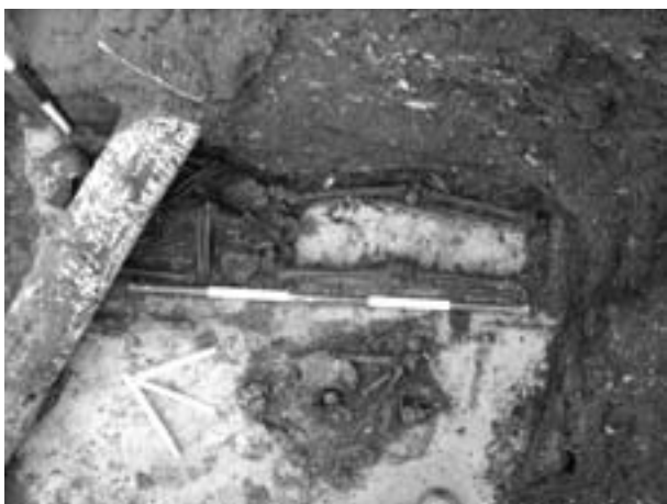
Obr. 45. Čejkovice, Masarykova, Templářská ulice. Kostí muže v druhotné poloze v jamce a kostra dítěte ze hřbitova u kostela.