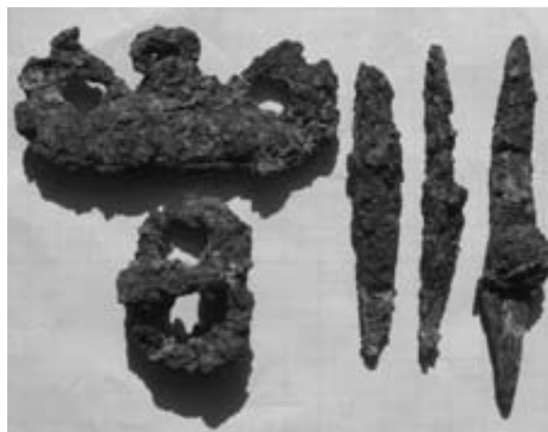
Obr. 46. Čejkovice, Masarykova, Templářská ulice. Železné přídatky z raně středověkého hrobu.