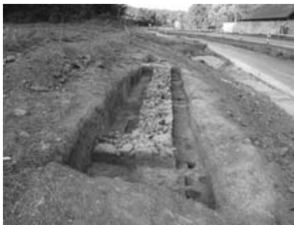
Obr. 44. Březolupy. Kamenné základy zaniklého hostince. Abb. 44. Březolupy. Steinfundament des ehemaligen Gasthauses.

Výzkum probíhal v trase přeložky silnice mezi Šarovy a Březolupy v trati Lapač. Mimo starší archeologické si-