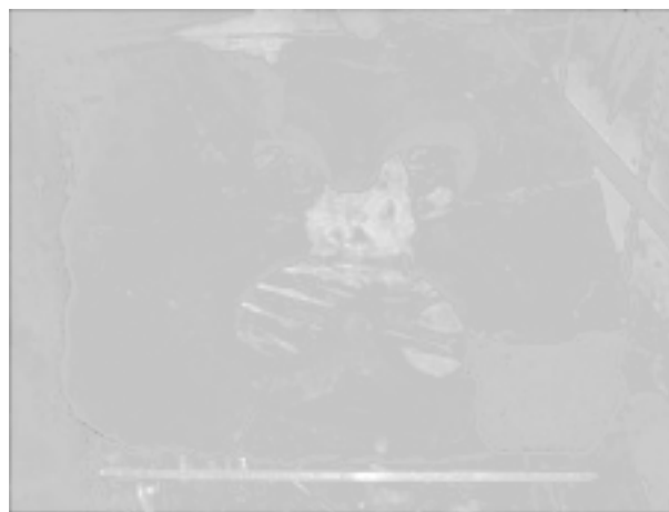
Obr. 79. Hrad Lukov. Okenní kružba ve tvaru čtyřlístu.

Abb. 79. Burg Lukov. Maßwerk in Form eines Vierpasses.