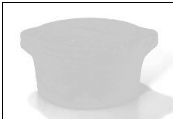
Obr. 66. Hostišová. Keramický kahan zdobený radélkem. Abb. 66. Hostišová. Keramische Öllampe mit Rädchenverzierung.

Během stavební činnosti, kterou představoval odkop zeminy pro oplocení domu č. p. 43, bylo strženo větší množství nadložních vrstev a rozrušeno propálené souvrství s větším množstvím keramiky. V horních vrstvách byla nejprve zachycena kamenná zídka mladšího datování (18.–19. století). Po začištění terénní situace byl pod zídou zdokumentován profil, který obsahoval propálené, přibližně 1 m vysoké souvrství. Z výzkumu vyšlo najevo, že se jedná patrně o hospodářskou usedlost, která lehla popelem někdy v průběhu 16.–17. století. Kromě keramiky byl v propálených vrstvách nalezen také větší soubor železných předmětů, které patrně patřily k výbavě stavení (petlice, háky, kruhy). V hloubce kolem jednoho me-