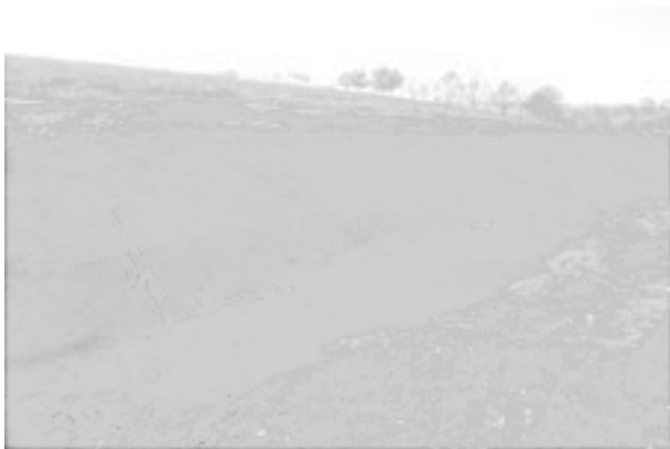
Obr. 114. Tučín. Pohled od východu na objekty 2500, 2501. Abb. 114. Tučín. Blick von Osten auf Gruben 2500, 2501.

vnitř prožlabeným. Ve výzdobě hrnců převažovaly horizontální obvodové žlábkové umístěné na plecích nádob či šikmé vrypy umístěné pod hrdlem. Výjimečně se objevil i motiv jednoduché vlnice. V jednom případě se vyskytl větší fragment zásobnice s okrajem vytaženým vzhůru, přičemž směrem nahoru se zužující. Zásobnice je zdobena plastickou lištou, na které je umístěna jedna řada šikmých vrypů. V některých případech bylo v keramické hmotě patrné vysoké procento přimíseného drceného grafitu. Ze zásypu objektu 2 500 dále pochází zlomky mazanice, jemnozrnného pískovce a sladkovodního vápence (travertinu), jehož zdroje se nacházejí při S okraji obce.