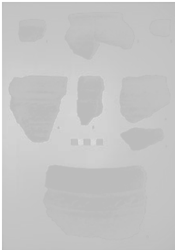
Obr. 115. Tučín. Výběr keramiky z 12. století. Abb. 115. Tučín. Auswahl der Keramik aus dem 12. Jahrhundert.

Uherské Hradiště (Bez. Uherské Hradiště), Masaryk Platz. Mittelalter, Neuzeit. Siedlung. Rettungsgrabung.