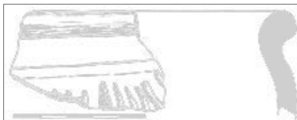
Obr. 7. Popice. Zlomek laténské keramiky.

Abb. 7. Popice. Fragment of the La Tène period pottery.