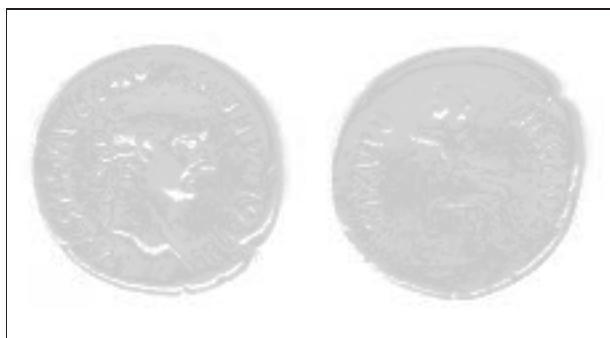
Obr. 9. Rymice. Denár císaře Tiberia. Abb. 9. Rymice. Denar des Kaisers Tiberius.