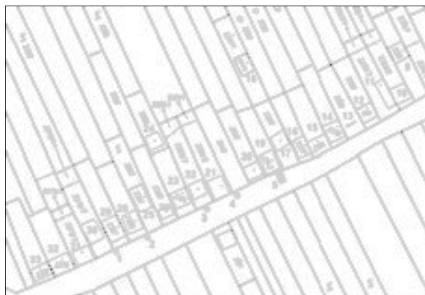
Obr. 104. Prušánky. Situační plán s vyznačením obilnic (1–4) a zahloubeného objektu (5).

Západní výkop základového pasu stáčírny a skladu zachytil linii masivního základu z neřádkovaného travertinu, zapuštěného do jílovité podložní vrstvy v zaměřené úrovni 208,95 m n. m. Charakter vrstev, nacházejících se nad jílovitým podložím JZ od travertinového základu, od-