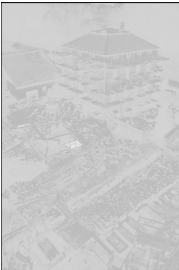
Obr. 3. Bohušov. Hřbitov při kostele sv. Martina, pohled na sondu S2/2010.