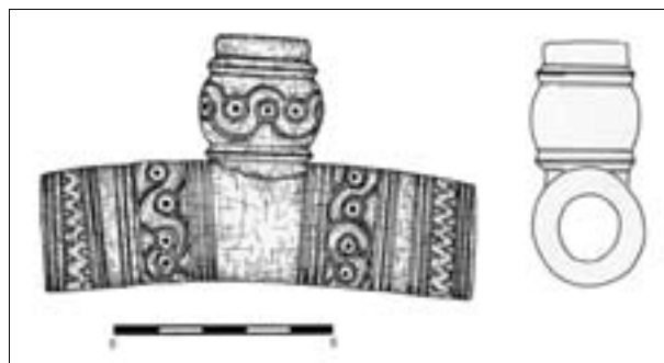
Obr. 82. Modřice, Havlíčkova ulice. Parohový předmět z hrobu 802.

Abb. 81. Modřice, Havlíčkova Straße. Der Plan des untersuchten Grabungsfläche mit bezeichneten Grabgruben.