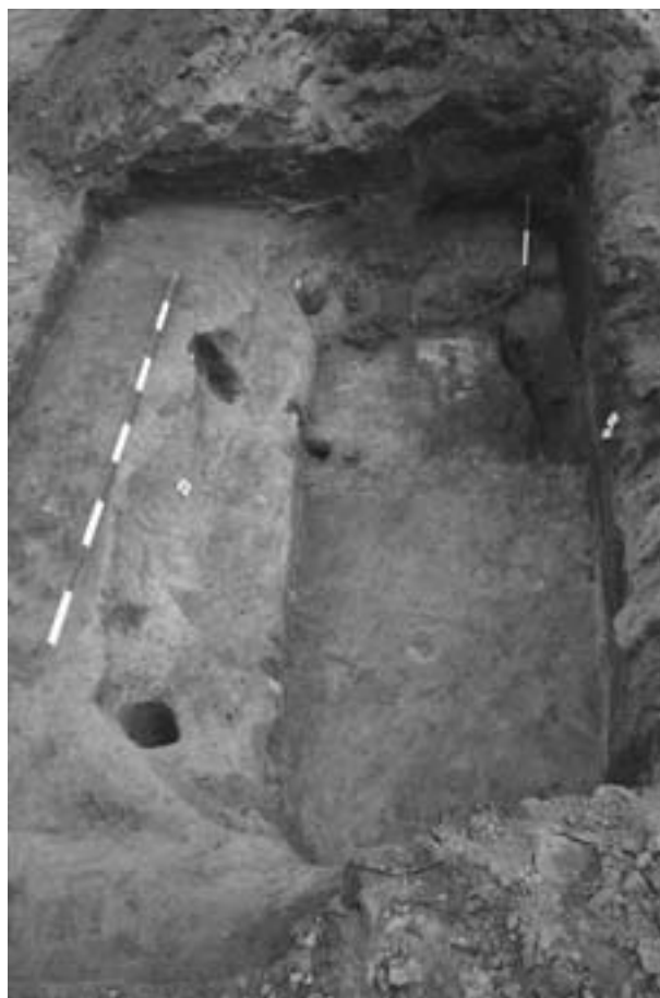
Obr. 122. Veselí nad Moravou, Bartolomějské náměstí.

Nejmłodším dokumentovaným objektem se stal sklep a zdivo jižně od domu č. p. 33. Obojí náleželo domu zburanému po druhé světové válce, avšak podle konstrukce klenby sklepa můžeme uvažovat o jeho vzniku již někdy v průběhu raného novověku.