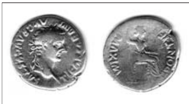
Obr. 9. Rymice. Denár císaře Tiberia.