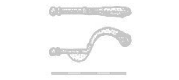
Obr. 10. Tovačov. Fragment samostřílové spony s vysokým zachycovačem.