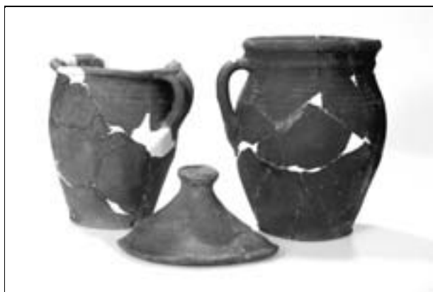
Obr. 118. Valašské Klobouky, Smetanova ulice. Výběr keramických nádob z 15. století.