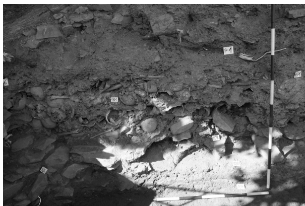
Obr. 56. Budišov nad Budišovkou. Skládka kostí.

Abb. 56. Budišov nad Budišovkou. Das Hangprofil. Die Knochendeponie.