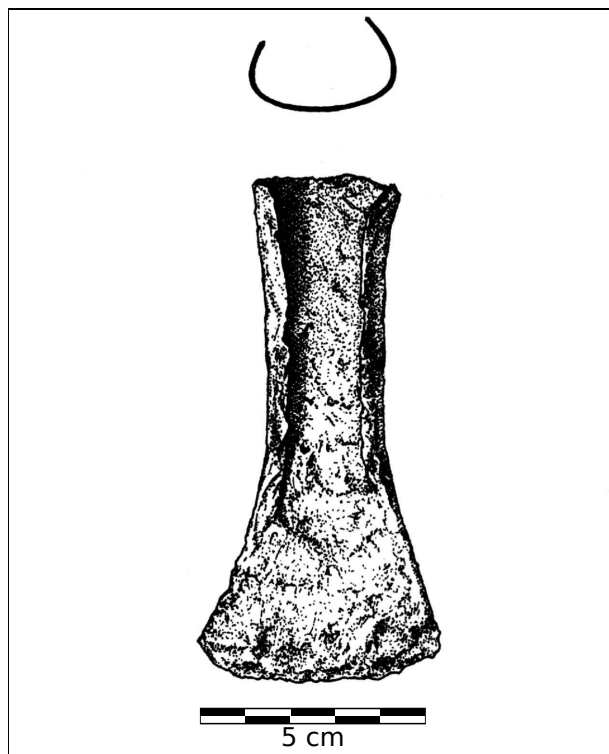
Obr. 18. Slatinice. Železná sekerka. Abb. 18. Slatinice. Eisernes Beil.