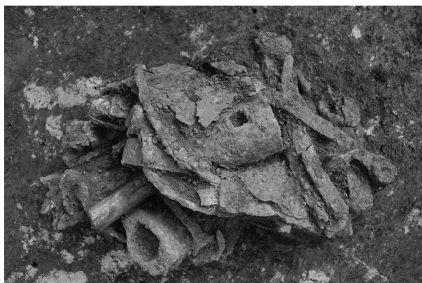
Obr. 1. Blažovice. Depot železných předmětů.