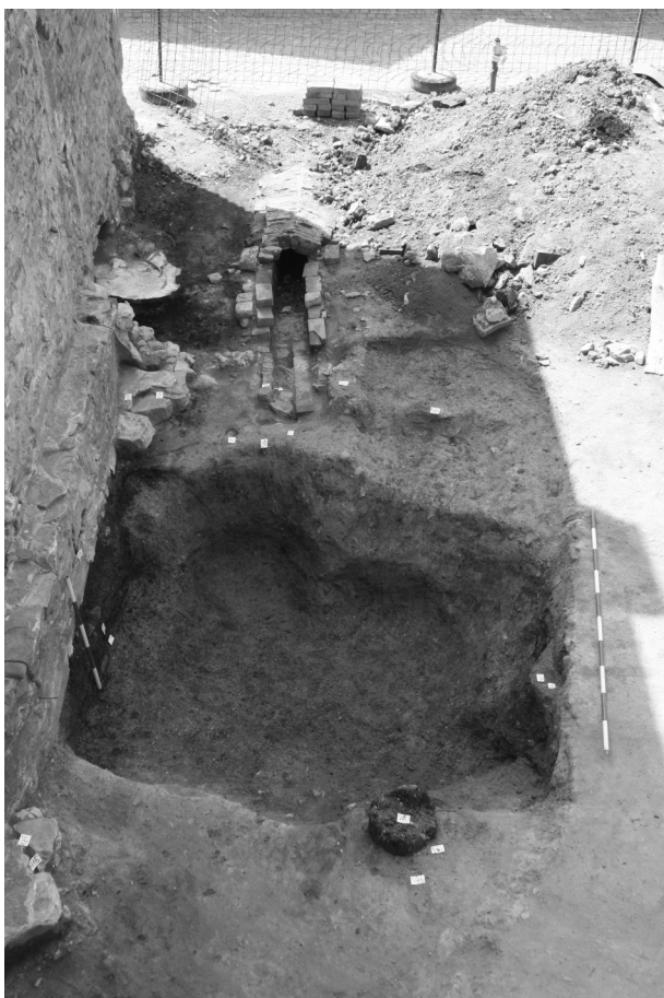
Obr. 110. Příbor. Zahloubený objekt v prostoru dvora (14. století). Foto Marek Kiecoň.

Abb. 110. Příbor. Die Grube im Raum des Hofes (14. Jahrhundert). Foto Marek Kiecoň.