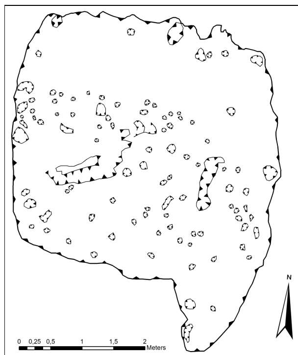
Obr. 8. Modrá. Půdorys objektu O5. Abb. 8. Modrá. Grundriss des Objekts O5.

Objekt O5 z doby laténské byl obdélníkového tvaru o rozměrech 4,2 × 4 m s orientací Z–V (obr. 8). Na východní polovině jižní strany se k objektu připojuje elipsovité vstupní výběžek o rozměrech 1 × 1,3 m. Výplň objektu byla tvořena vrstvou černozemě o mocnosti cca 25 cm. Uprostřed západní a východní strany byly zachyceny masivní kúlové jamky (průměr 25–30 cm), další drobnější kúlové jamky (průměr 15–20 cm) byly zachyceny podél severní strany objektu. Samotné dno objektu je pokryto drobnými kúlovými jamkami (průměr 5–10 cm), které se shlukují do menších skupinek a utvářejí nepravidelné řady. Celkem bylo zachyceno 860 fragmentů keramiky z časně laténské doby LT A. Jedná se zejména o keramiku z tuhovaného a potuhovaného materiálu a o užitkovou keramiku z hrubého materiálu (obr. 9). Z tvarového hlediska se objevují okraje misek s dovnitř zataženým okrajem, misky s esovitou profilací hrdla z jemného materiálu, okraje hrdel hrnců z hrubšího tuhového materiálu zdobené plastickou lištou, dohlčky či zářezy a také dva fragmenty láhve z jemného plaveného materiálu zdobené kolkováním. Dále bylo zachyceno 21 fragmentů závaží, 2 železné nože, 1 železné ko-