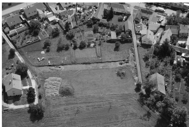
Obr. 113. Rajhradice. Pohled na zkoumanou plochu od západu, foto I. Čižmář.

Abb. 113. Rajhradice. Grabungsfläche von Westen. Foto I. Čižmář.