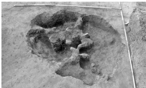
Obr. 84. Modrá. Středohradištní pec, pohled ze severu.

Abb. 84. Modrá. Ofen aus der mittleren Burgwallzeit, Blick von Norden.