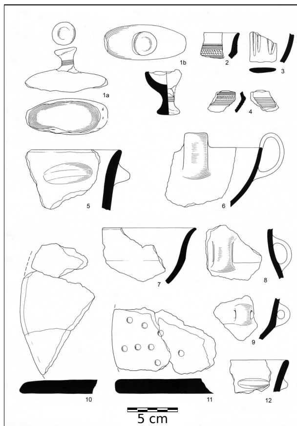
Obr. 4. Holešov. Výběr nálezů z objektu K 531.

Abb. 3. Holešov. Auswahl der Funde aus dem Objekt K 503.