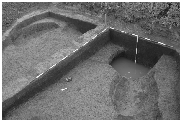
Obr. 2. Holešov. Pohled na starolátenský sídlištní objekt K 503.

Jako polohu 1 jsme označili místo s nálezy z období lužických popelnicových polí, lokalizované na nízkém návrší v nejjihnější části průmyslové zóny. Jde o nenápadnou vyvýšeninu převyšující okolní terén sotva o několik metrů, která byla vzhledem k hydrogeologickým poměrům jedním z mála míst v širším okolí vhodným k zakládání trvalejších lidských sídel. Během měsíce dubna 2009 bylo na ploše inkriminovaného úseku přeložky prozkoumáno 40 archeologických objektů, především z období lužických popelnicových polí, ale také ze starší doby laténské. Intruze v některých objektech (přeslen, štípaná industrie)