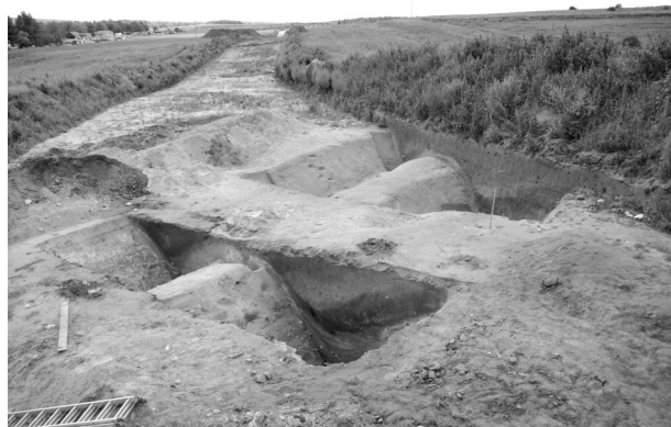
Obr. 9. Pasohlávky. Část fortifikace římské opevněné báze na Hradisku u Mušova.