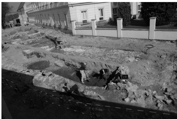
Obr. 139. Znojmo, centrum města. Pohled na část ulice Přemyslovců během výzkumu.

Po přesunutí stavební činnosti z Horního náměstí na Václavské se pozornost záchranného výzkumu soustředila především na dokumentaci dříve neporušených ar-