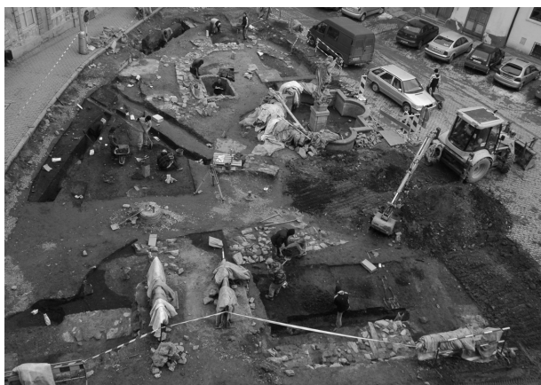
Obr. 140. Znojmo, centrum města. Celkový pohled na severní část Václavského náměstí s kostelem sv. Petra a Pavla.

Fig. 140. Znojmo, the centre of the town. General view of the north part of Václav square with St. Peter and Paul Church.