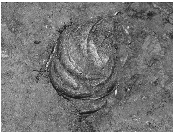
Abb. 40. Vysoké Pole – „Klášťov“ – depot bronzových náramků.