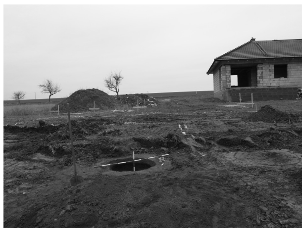
Obr. 11. Náměšť na Hané. Pracovní snímek zkoumané plochy. Abb. 11. Náměšť na Hané. Foto aus der Ausgrabung.

byly na tomto místě při stavbě tří rodinných domků prozkoumány či ovzorkovány a zdokumentovány 2 desítky platěnických objektů.