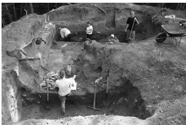
Obr. 58. Deštná, Rumberk. Pohled od západu na sondu S1 v severovýchodní části hradu.

Abb. 58. Rumberk. Testpit S1 in the north-eastern part of the castle. View from west.