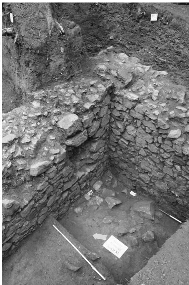
Obr. 59. Deštná, Rumberk. Pohled od jihozápadu na část sklepa v sondě S2 v jihovýchodní části hradu.

V souvislosti s předem neohlášenou demolicí objektu č. p. 393 proběhl rozsahem omezený záchraný archeologický výzkum (NPÚ Ostrava, akce č. 20/09). Byly dokumentovány stěny výkopů pro základové zdivo plánované novostavby (profily P1–P5; obr. 60) v místech původního domu, spoluvytvářejícího do jeho demolice severní uliční frontu Masarykovy ulice. Demolici nepředcházela stavebně historický průzkum, obytná stavba je však v této pozici zachycena indikační skicou stabilního katastru z roku 1833 (zde pod číslem 87) a nejstaršími dochovanými pohledy na město (např. celkový pohled na město od severu, kresba G. Herberta z roku 1730).