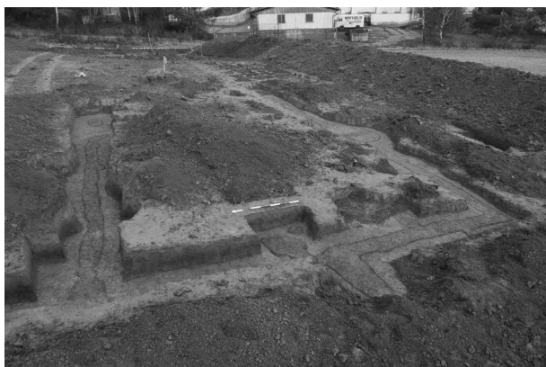
Obr. 7. Jinačovice. „Za Sýčkami“. Celkový pohled na dům kultury s moravskou malovanou keramikou.

Abb. 7. Jinačovice. „Za Sýčkami“. Gesamtblick auf das Haus der Kultur mit der mährischen bemalten Keramik.