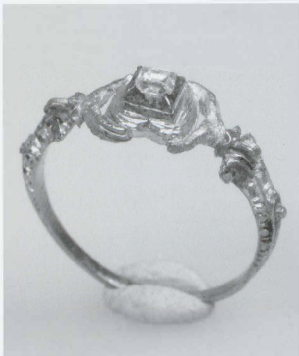
Obr. 60: Jihlava, kostel sv. Jakuba. Zlatý renesanční prsten z hrobu č. 120. Abb. 60: Jihlava, Kirche des hl. Jakobs. Der Goldring aus dem Grab Nr. 120.

Kopec „Tepenec“ s hradiskem popelnicových polí a středověkým hradem se nachází na okraji Nížkého Jeseníku, poblíž obce Jívová, zhruba 15 km severovýchodně od Olomouce. Lokalita je na mapě ZM ČR 1:10 000, kladový list 25–11–01, identifikována těmito koordináty (měřeno od ZSČ:JSČ): 220:317, 243:335, 254:350, 256:370, 250:376, 234:376 mm. Nadmořská výška se pohybuje v rozmezí 480–516 metrů. Výzkumná plocha se nacházela v areálu předhradí (hradní jádro i část předhradí je již odtěženo).