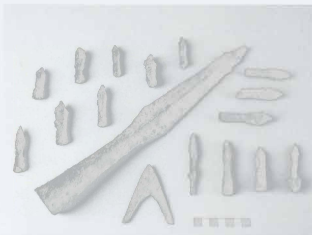
Obr. 61: Jívová. Výběr z nalezených středověkých militárií (stav před konzervací). Abb. 61: Jívová. Militariauswahl (Der Stand vor der Konservierung).

Kopec „Tepenec“ s hradiskem popelnicových polí a středověkým hradem se nachází na okraji Nížkého Jeseníku, poblíž obce Jívová, zhruba 15 km severovýchodně od Olomouce. Lokalita je na mapě ZM ČR 1:10 000, kladový list 25–11–01, identifikována těmito koordináty (měřeno od ZSČ:JSČ): 220:317, 243:335, 254:350, 256:370, 250:376, 234:376 mm. Nadmořská výška se pohybuje v rozmezí 480–516 metrů. Výzkumná plocha se nacházela v areálu předhradí (hradní jádro i část předhradí je již odtěženo).