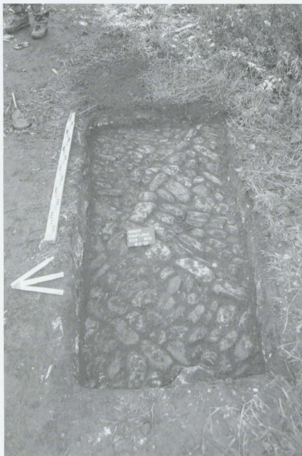
Obr. 65: Krnov. Foto valounové dlažby. Abb. 65: Krnov. Photo des hehlingen Pflasters.

dlažbu z 19.–20. století (obr. 65). Pod valounovou dlažbou jsme prozkoumali novověký kruhový objekt, na jehož dně byla uložena nádoba. Výplň objektu tvořil šterk.